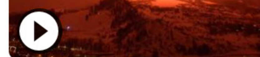
Zwaarste stuk vuurwerk ooit kleurt hemel rood in Colorado