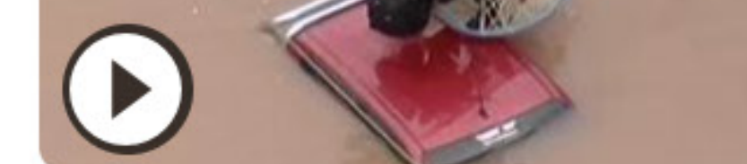
Mensen gered van autodaken bij overstromingen in Brazilië