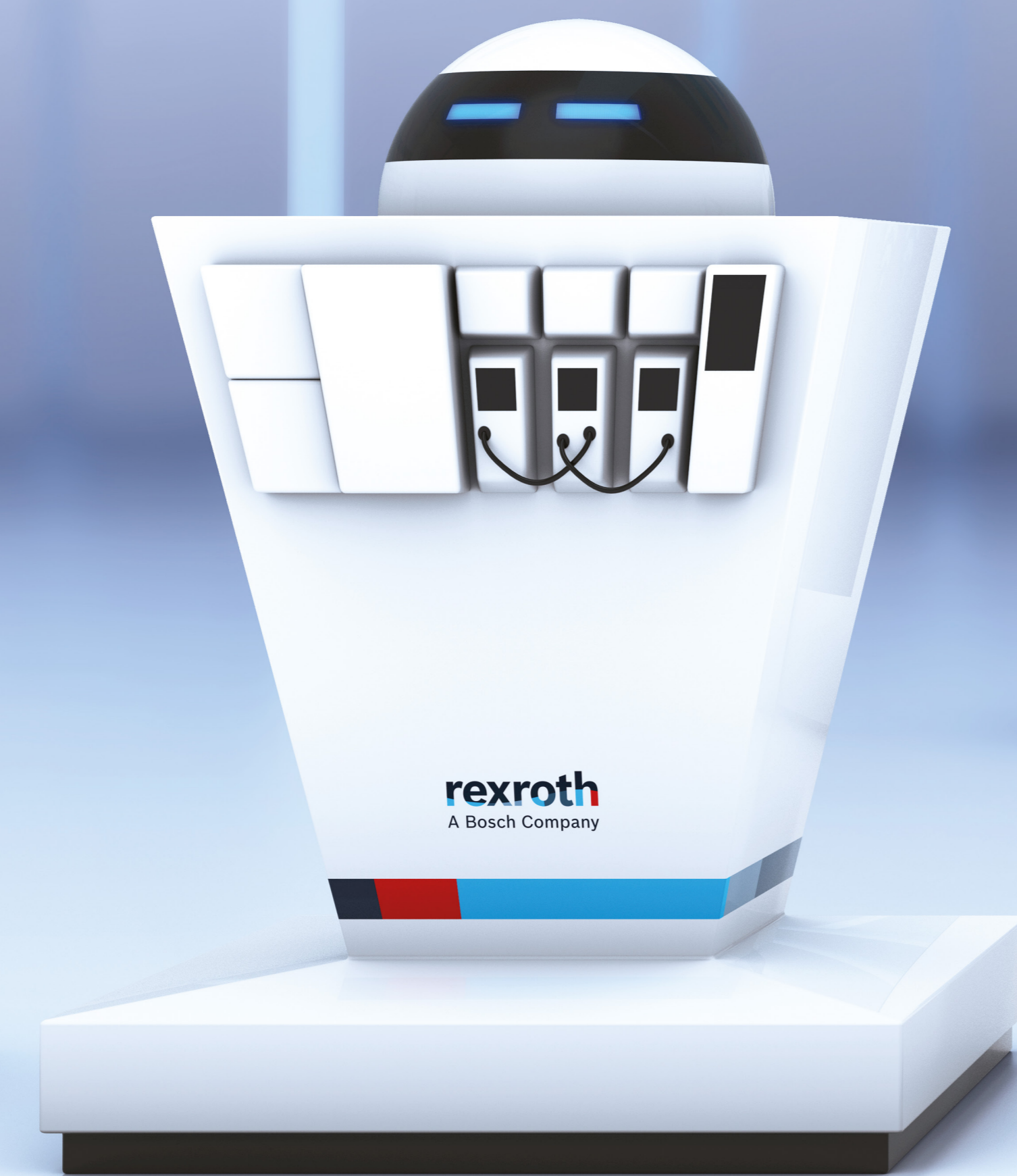
The Personal Trainer IoT Gateway