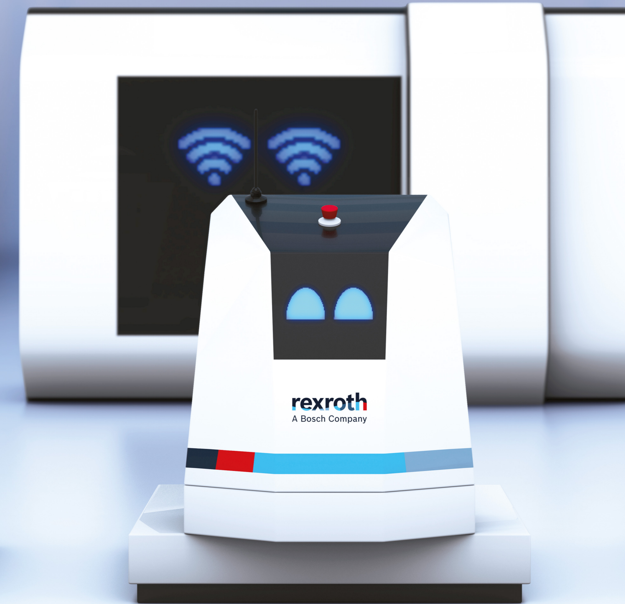
The Delivery Guy ActiveShuttle