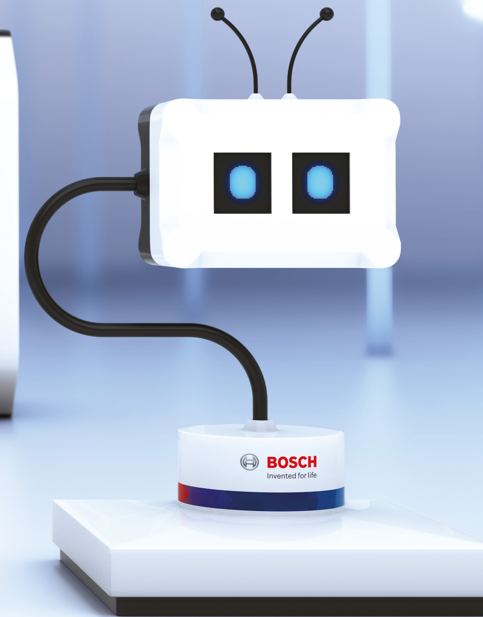
The Messenger XDK Sensor