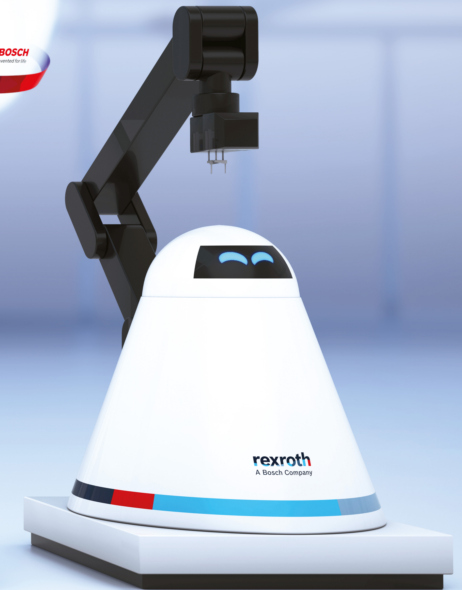
The Team Player APAS assistant