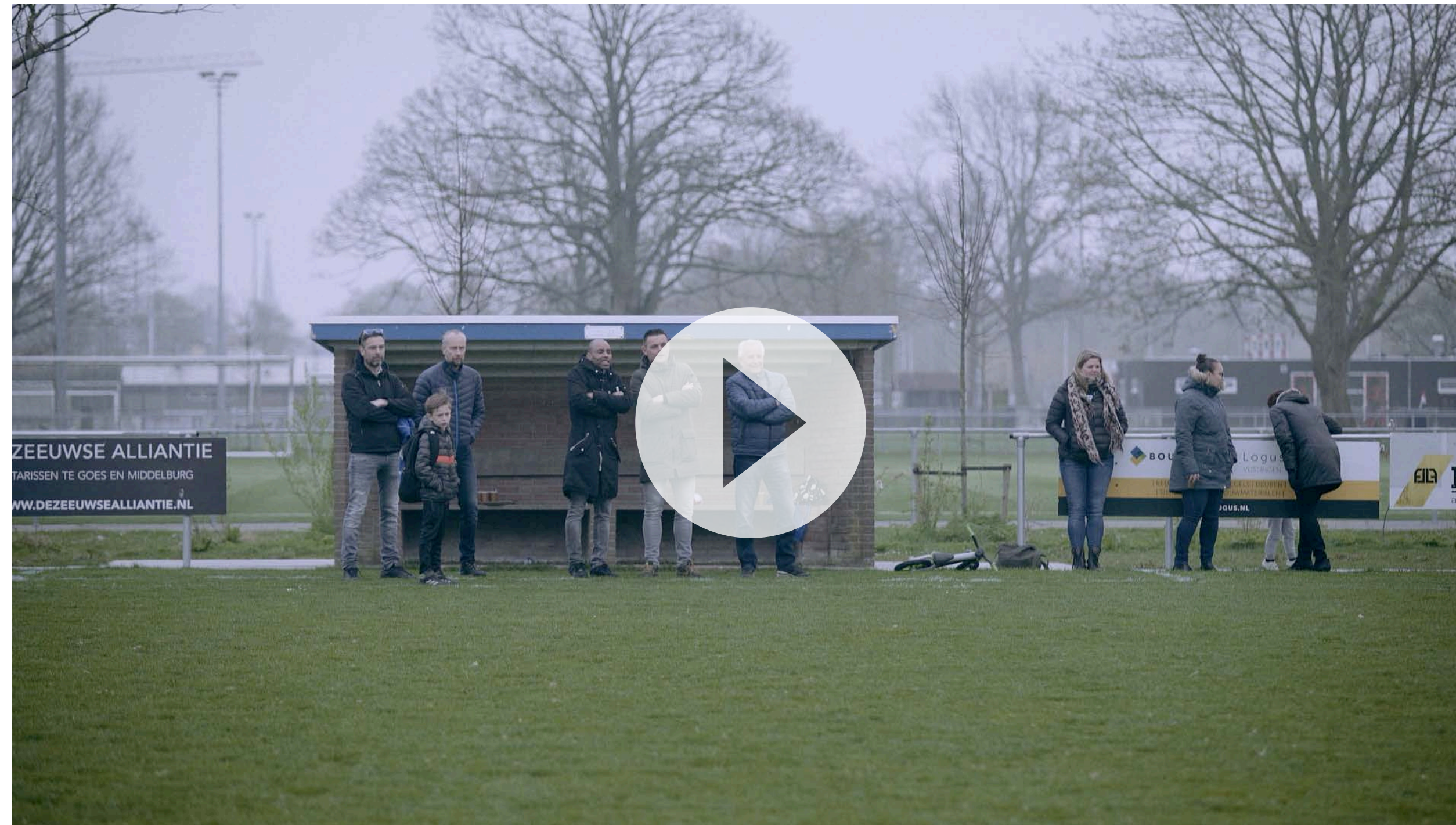
MOODFILM 'JOUW INZET IS GOUD WAARD'