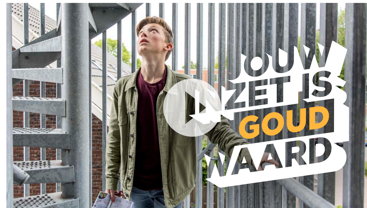
SOCIAL VIDEO RICHTING LOTENVERKOPERS