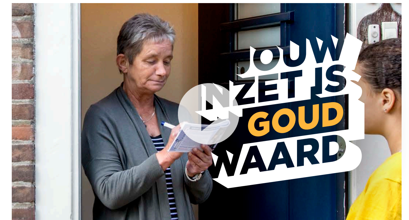
SOCIAL VIDEO RICHTING LOTENKOPERS