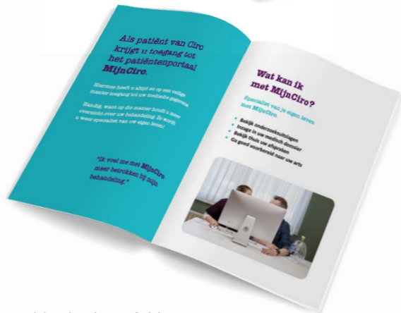
Folderdisplay + folder