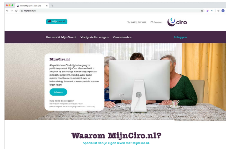
Mijnciro.nl (landingspagina met uitleg)