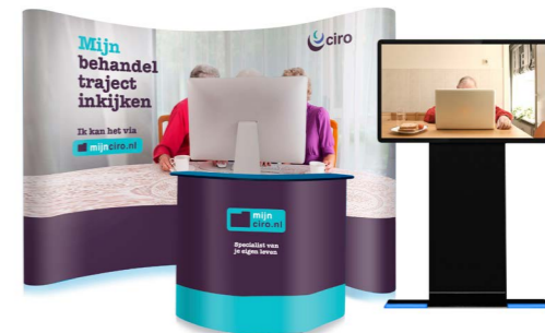
Informatiepunt in Ciro-Horn