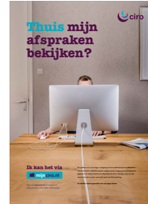
Posters (in wachruimtes en spreekkamers)