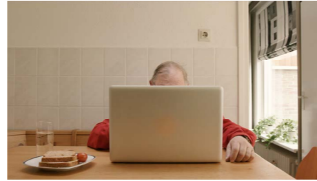
Filmpje Patiënten (narrowcasting)